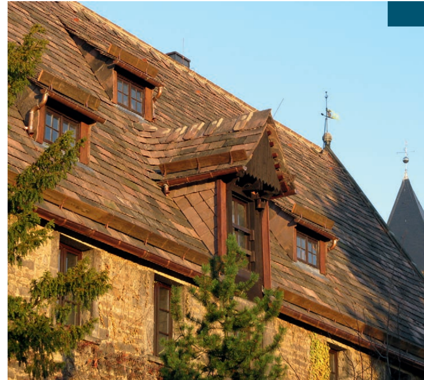
Teilansicht des instandgesetzten Daches vom sogenannten Taubenschlag im Stift Obernkirchen

Möglicherweise auf dem Boden der alten Bückeburg als Augustiner-Chorfrauenstift gegründet, geben die Gebäude und Anlagen des Stifts Obernkirchen heute Zeugnis von einer 850-jährigen wechselvollen Geschichte. Besonderes Merkmal der Anlage ist die durchgängige Verwendung der ortstypischen Fassaden- und Dachbaustoffe aus Obernkirchener- und Sollingsandstein. Nach der Sanierung des Finkenheims – die Nutzung als Landfrauenschule brachte im letzten Jahrhundert einigen Stiftsgebäuden die