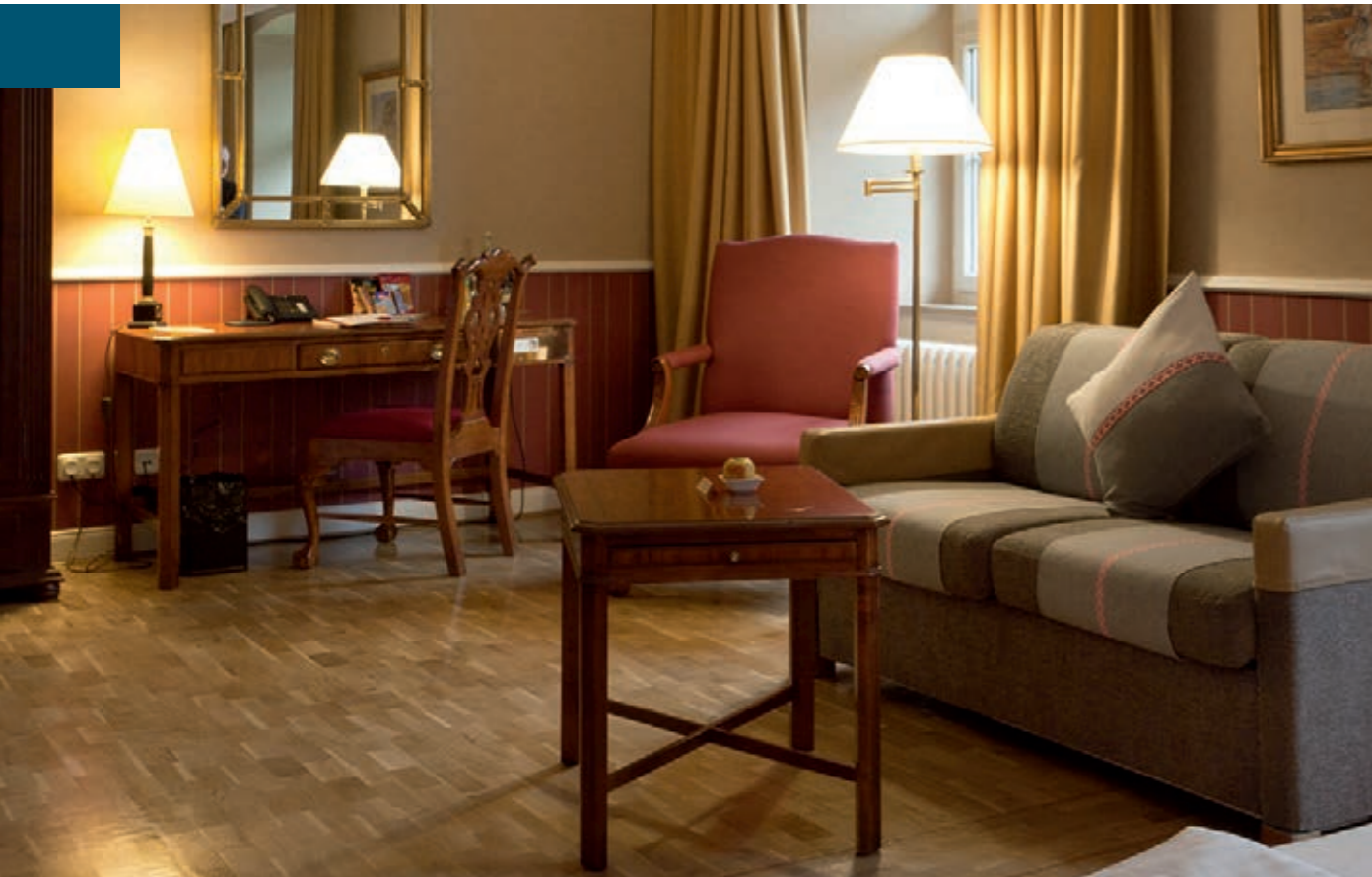
Klosterhotel Wöltingerode Blick in eines der 20 im Jahr 2012 zusätzlich eingerrichteten Hotelzimmer

Auslastung im Tagungs- und Seminarbereich war der Ausbau zusätzlicher Zimmer erforderlich geworden. Neben Hochzeiten und Familienfeierlichkeiten ist das Hotel insbesondere im Tagungsbereich und bei Firmenevents in seiner klösterlichen Abgeschlossenheit gepaart mit einem komfortablen Ambiente bei Firmen in der Region sehr beliebt.