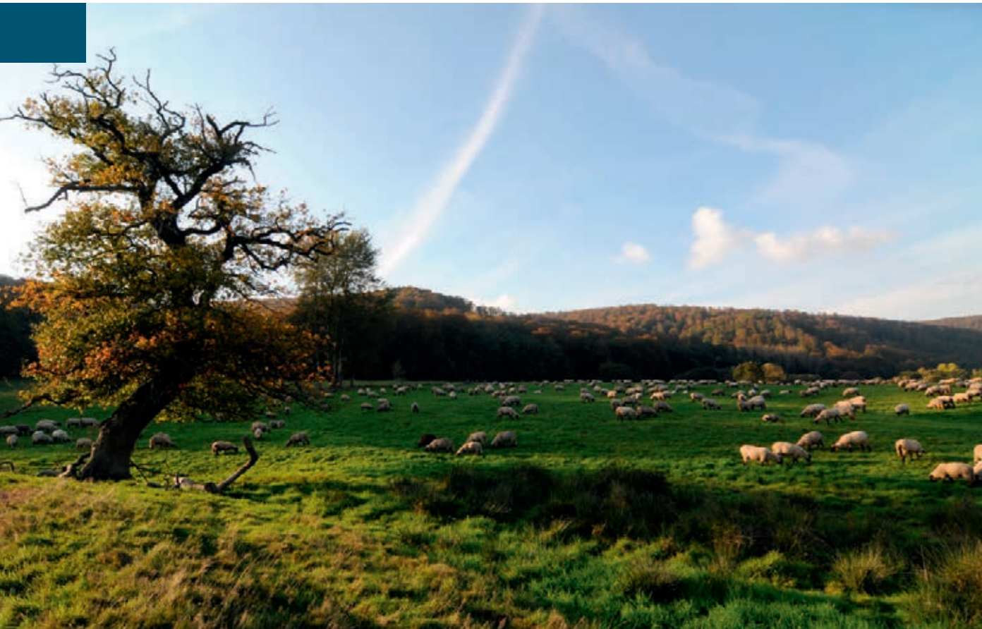
Schafweide auf dem Klostergut Hilwartshausen bei Hann. Münden