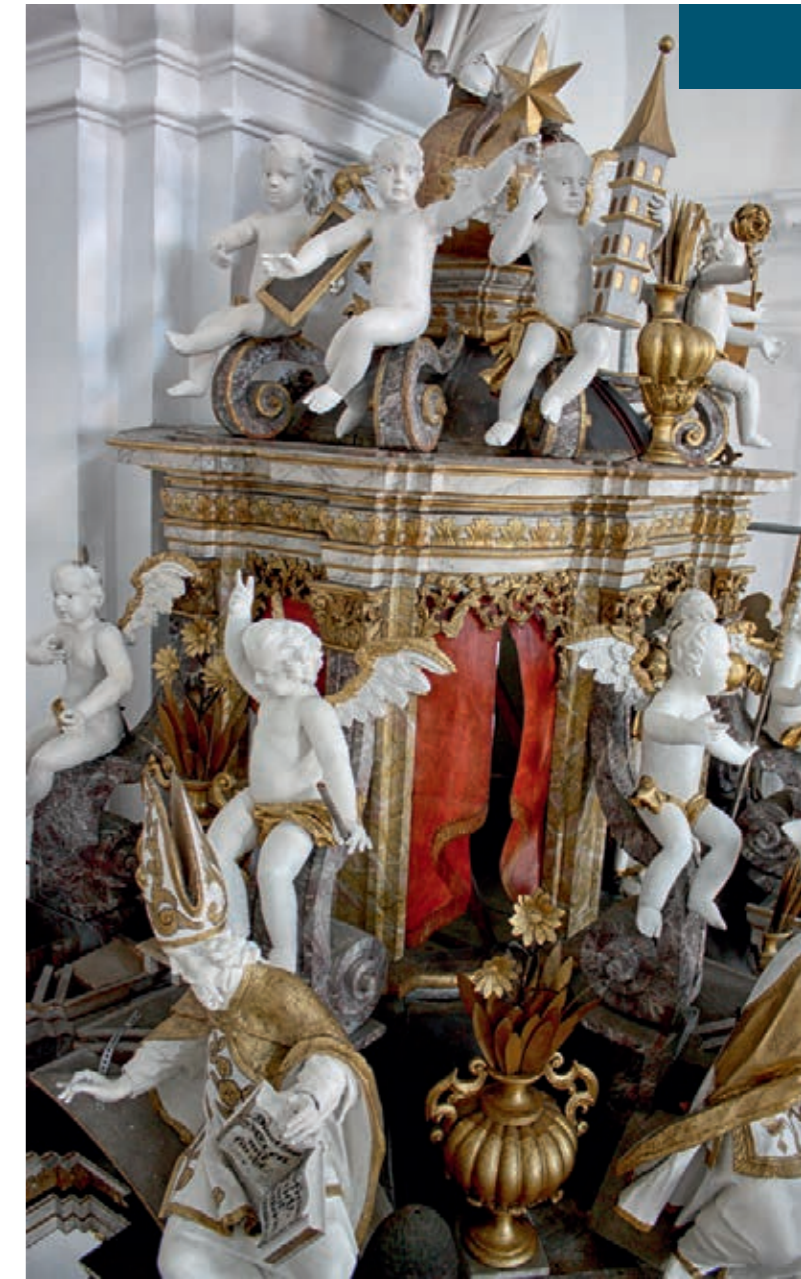
Ehemalige Klosterkirche Grauhof Schalldeckel der Kanzel nach Abschluss der Restaurierung