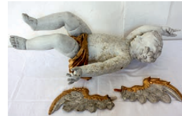
Ehemalige Klosterkirche Grauhof Engelsfigur vom Schalldeckel der Kanzel nach der Reinigung der stark geschädigten Fassung

mit zeitgenössischen Zweitfassungen verschmolzen hatte. Erschwerend kam hinzu, dass sich auch der darauf abgelagerte Staub untrennbar mit der Malerei verbunden hatte. Dadurch war ein völlig anderes Kolorit entstanden. Außerdem hatte die dicke „Malschicht“ zu Oberflächenspannungen geführt, sodass große Partien der Fassung ihre Haftung verloren hatten. Partiiell war sogar der Träger mit hochgerissen worden, sodass sich an der ablösenden Malschicht Holzspäne befanden. An vielen Partien musste die abgefallene Fassung durch eine Neufassung ergänzt werden.