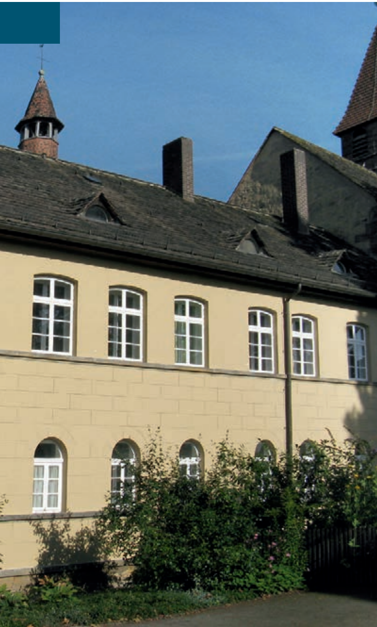
Die Fassade des Münchhausenbaues im Stift Fischbeck nach der Erneuerung